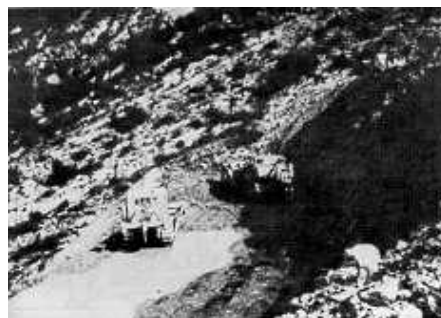
Fig. 3: Interferencia entre máquinas