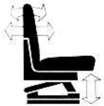
Fig. 6:

Básicamente su función es la de paliar las muy probables lesiones de espalda del conductor y el cansancio físico innecesario del mismo.