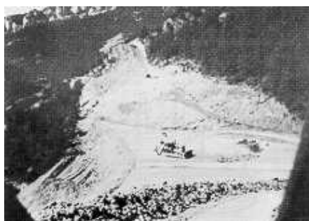
Fig. 4: Trabajo en proximidad talud