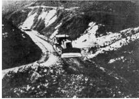
Fig. 5: Vuelco máquinas

La mayor dificultad de esta cabina para proteger al conductor del polvo, ruido y los rigores climáticos estriba en las duras condiciones en que trabaja la máquina y por lo tanto el mantenimiento tiene que ser muy frecuente y al no ser un elemento fundamental para el funcionamiento de la máquina no se utiliza.